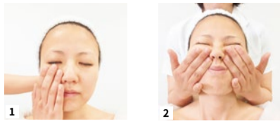
1 施術前、クレンジングでしっかり汚れを落とし清潔にして肌の調子を整える。 2 ほうれい線の原因という溜まった脂肪や老廃物に働きかける。座って行うことで血流やリンパの流れが3倍もアップ!

田中有久子先生から受け継いだ数種類のハンドマッサージで、老廃物を静脈やリンパへ流し込んで除去。ストレスや肩・首のコリ、目やあごの疲れもスッキリ! 完全個室でリラックスできるうえ、気持ちよい接客サービスも評判。