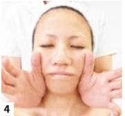
4 皮膚表面だけでなく筋肉まで丁寧に刺激して、肌の内側から活性化を促す。透明感とハリが生まれ、肌質が変わっていくの体感。