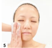
5 オリジナルの化粧品で、十分に保湿。プリプリ肌の小顔美人の完成!