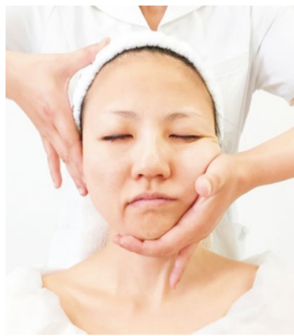
たったの30分という即効性も魅力で、毎日忙しい女性から根強い支持を得ている。しかも、1回でリフトアップ&小顔に! 大好評につき、1ヶ月前の予約がオススメ。

30分で感激の小顔へ&たるみ・ほうれい線・しわもスッキリ 田中有久子考案『造顔マッサージ®』正規継承サロン