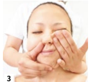
3 圧を加えて、潰した脂肪や老廃物の脂肪や老廃物をギュッと圧を加え、リンパに流して排出。脂肪や老廃物が溜まっている人ほど「イタ気持ちいい」の声。目元や口元、輪郭がどンドン引き上がるのを実感。一回り小さくなったフェイスラインにびっくりするはず。