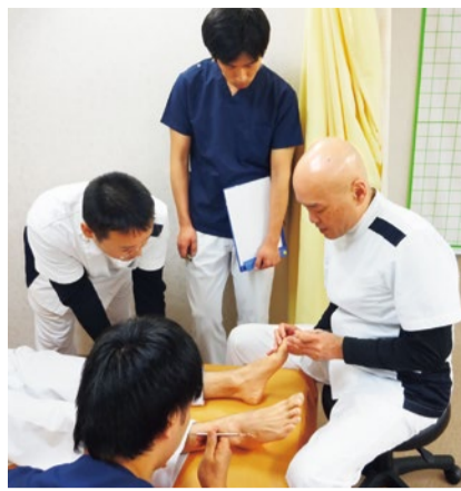
▲代表木方さんの施術手法は業界内でも有名で、他院院長にも教えている。

まだまだサンダルやミュールが手放せず、足を露出することの多いこの季節。外反母趾や巻き爪などによる痛みで、足元のオシャレをあきらめているなら、ご注目。同院は、TVなどメディアでもおなじみの足指ソムリエが足の悩みを改善してくれると、はるばる沖縄・広島・静岡、なかには台湾から通う人もあるほどの評判。外反母趾や巻き爪は、放置しても悪化することがほとんど。脚をかばって歩くはめになり、不格好なO脚など、深刻な事態を引き起こすこともある。痛い足を放っておかず、重症化する前にぜひ相談を!