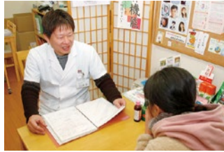
漢方の専門用語はなるべく使わず、わかりやすく説明してくれる

不妊症とは、赤ちゃんを育む力「妊娠力」がなんらかの理由で不足した状態。この妊娠力を高めるには、病院での治療と並行して漢方治療をプラスすることが近道だといふ。同薬店では、病院での治療だけではどうしてもできない、卵子の質を高める、着床しやすい子宮内環境を整える、女性ホルモンのバランスを整えるといった体質改善の部分を漢方の力を使ってサポート。さらに、食事や生活習慣の見直しアドバイスによって「妊娠しやすい体づくり」へ導いてくれる。相談は無料。ぜひ一度訪れてみて。