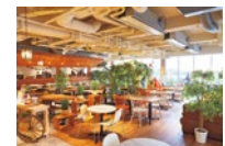
かわいいテント風テーブル席のほか、テラス席もある店内。

立命館大阪いばらきキャンパス内というロケーションに加え、「わが家」気分でくつろげる、ログハウス風の広々とした空間もおしゃれなカフェ。イチオシは、上質食材を使ったリーズナブルな洋風創作ランチ。カフェタイムは人気のデザートを楽しんで。全メニューが日替わりor週替わりとあって、毎日でも通いたくなりそう!