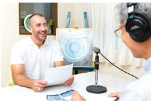
(上)発声時の周波数を変換する「電子耳」装置を使用。装置を通して聞こえる声の変化に驚かす。 (左)トマトリスメソッドに基づいた外国人講師による英語のマンツーマンコースも。6,000円/90分。

9/26(水)開催の「生活上セミナー」にて体験セミナーを開催。詳しくはP.12の関連記事をチェック!