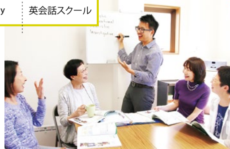
(上)「間違ってもOK」というアットホームな雰囲気なので、恐れずどんどん発言できる。自己流の表現もきちんと直してくれ、毎回「なるほど」と発見が多いそう。 (左)2歳前~未就学児の親子クラス「マミー&ミー」(火曜・10時15分~60分)は、英語の歌や遊びを通して自然と英語が身につく。