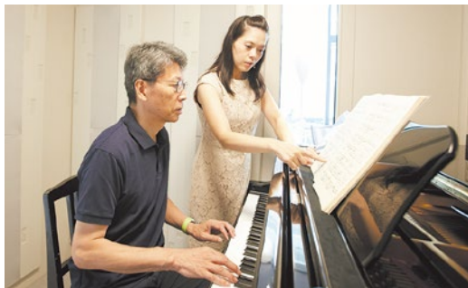
大人になってからの音楽って楽しい全てのレッスン無料体験あり。