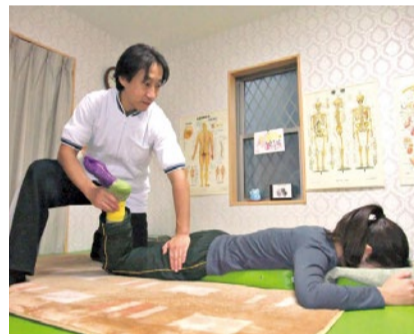
ソフトなタッチで、ついつい眠ってしまう優しい整体

西宮北口駅すぐにある「活源堂」は、産後の骨盤矯正や腰痛に特化した専門院。出産後の体調不良(ホルモンバランスの乱れ、不眠など)を改善したい方や、骨盤を引き締めて体型に戻りたいという方が数多く訪れている。産後不調の主な原因は自律神経の不調にあり、同院では足首とおへそ周りを中心にソフトタッチの整体で調整、脳に刺激を送ることで自律神経を正常なバランスに保つという。自宅でのセルフケアの方法も丁寧に教えてくれるので、気になる症状がある方は一度訪れてみては。