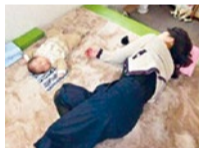
赤ちゃんと一緒に寝転びながらの施術もOK!

骨盤の歪みと腰痛で来院。1回目の施術から姿勢がピンと伸びるのを感じました。4回目には腰痛がなくなり、お尻のたるみも改善されました!(30代)