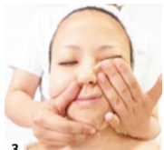
3 圧を加えて、潰した脂肪や老廃物や老廃物をギュッと圧を加え、リンパに流して排出。脂肪や老廃物が溜まっている人ほど「イタ気持ちいい」の声。目元や口元、輪郭がどンドン引き上がるのを実感。一回り小さくなったフェイスラインにびっくりするはず。