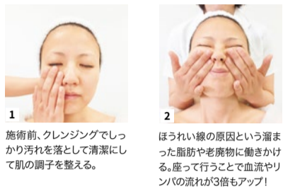
1 施術前、クレンジングでしっかり汚れを落とし清潔にして肌の調子を整える。

田中有久子先生から受け継いだ数種類のハンドマッサージで、老廃物を静脈やリンパへ流し込んで除去。ストレスや肩・首のコリ、目やあごの疲れもスッキリ! 完全個室でリラックスできるうえ、気持ちよい接客サービスも評判。