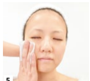
5 オリジナルの化粧品で、十分に保湿。プリプリ肌の小顔美人の完成!