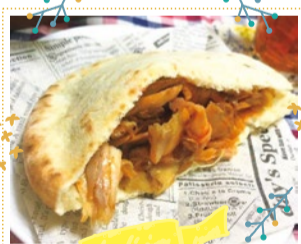
THE BEST KEBAB 10/6・7・8・12・13・14 出展

焼き菓子は体に優しい材料で、素材の風味を大切に作っています。低農薬野菜を使った季節のお野菜のスープの米粉ヌードルフォーも、野菜本来の甘みを大切に作ります。