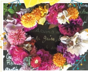
「旅する雑花屋」Cor 10/6・7・8・12・13・14 出展

木材を使用したインテリア雑貨や小物、家具などのハンドメイド作品。その他アクセサリスタンドなど。