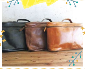
Drink up 10/6・7・8 出展

ベビー布小物(スタイ、ガラガラおもちゃ、カンヤカシャおもちゃ)、大人・子どもターバン、どんぐり帽子、ベレー帽。