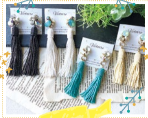
Victoire 10/8 出展

革靴、革靴、長財布やコインケース、キーリングや靴べらなどの革小物。すべてのアイテムは手作業で作っています。