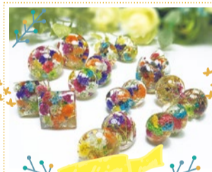
Mirage 10/8 出展

雰囲気ある色合いでアレンジリースの販売、服飾小物、フェイクフラワーアレンジなどをご用意しています。