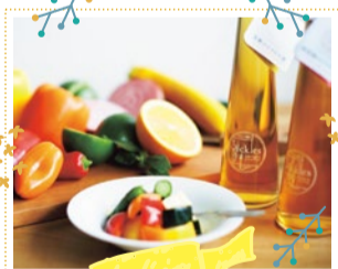
ピクルス屋 10/6・7・8・12・13・14 出展

原材料にこだわり、地元奈良県産のじっくり熟成させたお酢を使用。甘味にもこだわり、オーガニックのてんさい糖、パームシュガーなどを使用しています。