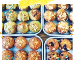
ECRUmuffin*エクリュ・マフィン 10/6・7・8 出展

原材料にこだわり、地元奈良県産のじっくり熟成させたお酢を使用。甘味にもこだわり、オーガニックのてんさい糖、パームシュガーなどを使用しています。