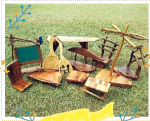
クラフトHTCM 10/6・7・8・12・13・14 出展

色々な銘木を使った飾り台やイス、お皿などの木工品。自然の風合いを極力生かした作品をご用意。