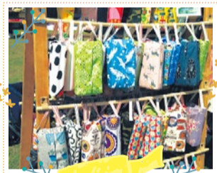
カントリーカジ 10/6・7 出展

優しい色使いで、丁寧に作りあげたオリジナル木工。ナチュラルやアンティーク風、シャビー風など沢山の品揃えでお出迎え。