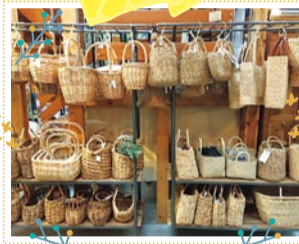
ロッタハウス 10/12・13・14 出展

季節の花や多肉植物などプランツ全般。生花を自然乾燥させて作ったドライフラワーのブーケ、リース、スワッグなどをご用意。