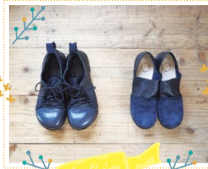
アトリエわか 10/6・7・8・12・13・14 出展

1927年創業の靴下製造メーカーのオリジナルブランド。人と自然に優しい素材を選んで丁寧に編み上げたつたです。