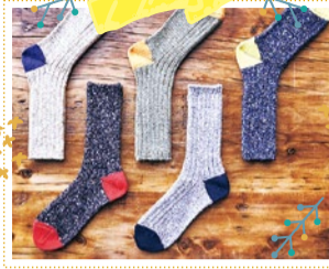
Re Loop 10/6・7・8 出展

色々な銘木を使った飾り台やイス、お皿などの木工品。自然の風合いを極力生かした作品をご用意。