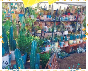
Colzaflower 10/12・13・14 出展

ビーズタッセルのピアス・イヤリングや普段使いから特別な日に使用できるアクセサリを制作、販売。オリジナルの一点物アクセサリです。