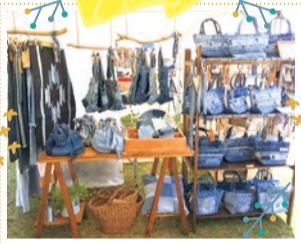
Atelier307 10/6・7・8 出展

ハンドメイドのエコティッシュカバー。便利に流されがちな昨今、人と地球の未来の為にロハスフェスタを通してロハスを多くの人に広めたいと思っています。