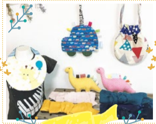
mosh&nina 10/8 出展

ベビー布小物(スタイ、ガラガラおもちゃ、カンヤカシャおもちゃ)、大人・子どもターバン、どんぐり帽子、ベレー帽。