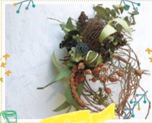
FineDay 10/6・7・8・12・13・14 出展

観葉植物などのグリーンを販売。リビングのテーブル、キッチン、玄関先、デスクの上などに飾れる、可愛くて小さなグリーンなど。