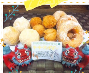
ドーナツハウスLOOP 10/6・7・8・12・13・14 出展

トルコ本場の美味しさそのままに、厳選されたスパイス、野菜は鮮度にこだわり地元(大阪産)のものをはじめ、国産野菜を使用したケバブをご用意。