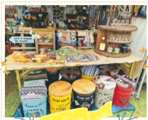
18store 10/6・7・8 出展

岡山デニムやUSEDデニム、帆布を使ったバッグやポーチ、エプロンなどの服飾雑貨、クッションやタペストリーなどのインテリア雑誌等を制作しています。