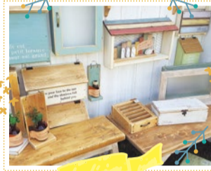
KanaHa 10/6・7・8 出展

東南アジアを中心に海外で、一つひとつ職人が手作業にて編んだかごバッグ、かご、バスケットなどを販売。