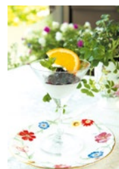
シェフのアイデアが光るスイーツも人気。「ブルーベリーとレアチーズのクープ」。単品600円。