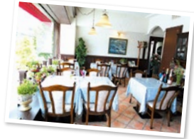
フランスの家庭のリビングをイメージした店内。開放的な窓から暖かい光が差し込む。