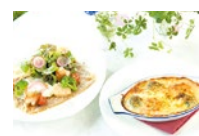
季節限定ランチは10月から「ガレットランチ」「グラタンランチ」がスタート。

特典 「シティライフを見た」でオーガニックグラスワインまたはソフトドリンクを1杯サービス(9月末まで)