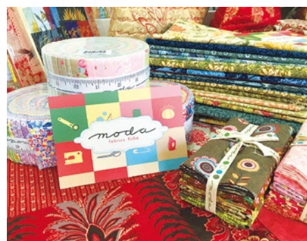
毎月100種類を超えるデザインがリリースされるので、来るたびに新しい色や柄に出会える。