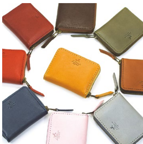
カラーは神戸の華やかな街や港、自然をイメージした8色と、季節限定カラーの中から選べる。

もりお工場のオリジナルブランド「アズワイス」は兵庫県産牛革にこだわり、職人が丁寧に縫製するラウンドファスナーウォレット。使い込むことで変わっていく風合いは天然皮革製品ならではのしっとり滑らかな質感は手に馴染み、シックながらもやわらかな印象を与える。もちろん、使いやすさも追求。中央の小銭入れスペースにはファスナーをつけず、スムーズに硬貨の取り出しが出来るようにした。ラインナップは手のひらサイズのコンパクトハーフウォレット(6,990円)、長財布のスリムロングウォレット(14,990円)の2種。親しい人へのプレゼントや自分へのご褒美におすすめしたい。