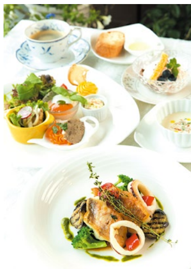
(上)フレッシュサラダが堂々主役を張る。このランチを目当てに訪れる人も多い。 (左)一番人気の「シェヴランチ」。前菜の盛り合わせ、旬の魚または肉から選べる。魚は山口県萩大島船団から水揚げされたもののみを使用。