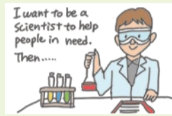
将来の夢について、理由と具体例を添えて英語で説明することができる。

大阪府教育庁では、今年度よりスピーキング力を伸ばす取り組みを進め、生徒の4技能をさらに伸ばすために、府立高校では、生徒が英語4技能をバランスよく身に付けることができよう、英語教育の充実に取り組んでいる。また、2020年度からは、大学入試において、民間の英語4技能試験の結果の活用が検討されており、今後ますます英語4技能をバランスよく育成することが重要になる。