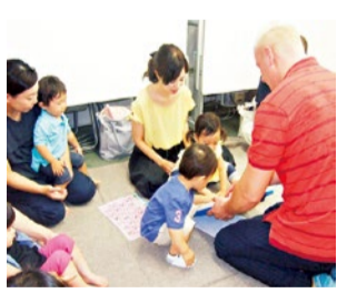
親子で自然な英語に慣れ親しめる!

実績42年。BabyBox(1歳~)は1レッスン1,100円。音楽やおもちゃを用いて親子で楽しむ英語育脳空間。プレ幼児(2歳半~)は親子で英語のキャッチボール! 児童コース(幼・小・中・高)は、外国人・日本人講師のチーム指導。基本コースは、英会話にプラスして英語脳を育てる独自のSV方式による文法指導、能力開発の速読、楽しみながら学ぶ英語実践ゲーム(中高生は英語速読)を加えた120分の充実レッスン。ネット活用の英検コースも人気。大人はOne-to-One(英会話・TOEIC・英検)、世界遺産を巡る「世界旅行英会話」が話題。