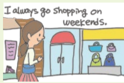
週末の行動について、まとまった英語で説明することができる。