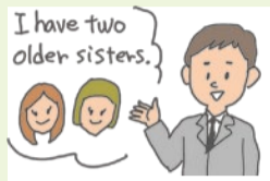
自己紹介を英語で行うことができる。