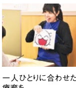
一人ひとりに合わせた療育を