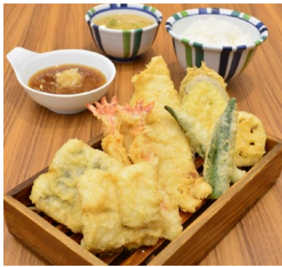
山の夏定食 1,100円 海老2尾、ハモ2尾、カレイ、ナス、レンコン、オクラ2個