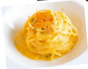
ウニのスパゲッティは、コレ目当てで訪れる人もいられるほどの人気メニュー。わざわざ食べに行く価値アリの一品。

読者限定ランチ ..... 5,500円相当→ 3,920円 (1日限定10食・要予約)