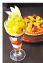
季節限定のピオーネのパフェ(1,094円/8月下旬から販売)と定番人気のフルーツタルト(1カット547円) ※全て税別

旬野菜のカボチャやブロッコリーがゴロゴロ入った季節限定の Pasta は、濃厚なチーズの味わいのゴルゴンゾーラソースで。一凛カレーは姉妹店の焼肉屋で使う特上牛をふんだんに使った特製カレー!「本日のおすすめセット」でも選べるのでぜひお得に味わって。