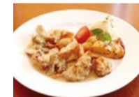
Aコースメインの鶏ももソテー。Bコースではメイロンが黒毛和牛コースステーキに。

5周年を迎えるみうらんど。例年人気のアニバーサリー企画から今年もお得なコースが登場。同店自慢の Pasta に加え、メインの鶏ももソテーはイタリア産ボルネーソースが美味。アニバーサリー前日の8/31(金)には前日祭も開催。テイクアウトのみの営業でケーキ全品がなんと半額!