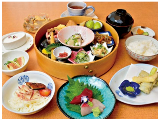
※写真は8月のうの花御膳

華やかな創作和食で多くのゲストを魅了している「うの花」。産地を厳選した旬の素材を使用し、20年以上和食に携わる料理長が調理法にこだわった料理が味わえる。おすすめは、美容と健康のバランスが抜群で豊かな彩りも楽しめる「うの花御膳(ランチのみ)」。ランチは前日までの予約のみ。夜は2,000円~愉しむことができる。掘ごたつの個室も有。