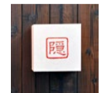
席数に限りがあるので予約がベター。

熱海の有名旅館など和食の世界で長年修業した店主が腕を振るう箕面の人気店「隠」。職人技が織りなす料理の数々に、北摂圏外からも熱い視線が注がれている。食材に手を加えずに和食の心はそのままに、お昼限定の特別ランチではリーズナブルに和の奥深さを味わうことができる。贅沢な一時をぜひ。