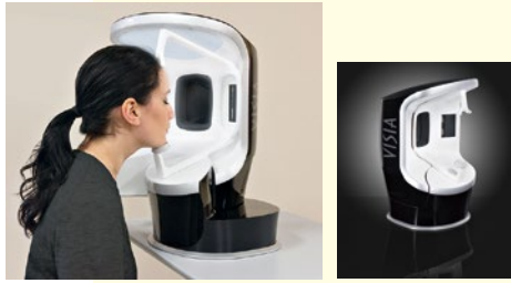
肌診断器 VISIA® (ビジア)

聖心美容クリニックでは肌年齢・毛穴数など現在の肌状態を正しく分析し、「隠れシミ」など肌に潜むトラブル予備軍まで発見できる、肌診断器「VISIA® (ビジア)」を導入している。