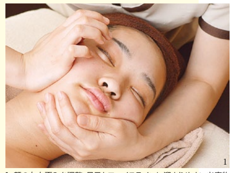
1. 顔の左右歪みを調整。目元とフェイスラインに溜まりやすい老廃物が流れるとシワやほうれい線がピーンと張り、引きあがった小顔に。

夏のダメージでむくんだ顔を放置するとたるみへ、日焼け後のケアを怠るとしみへと加速定着してしまう40代以降。だからこそ、たるみやしみが表面化する前に適切なケアを。「シルクde美骨顔筋マッサージ」は顔の歪みを調整しながら溜まった老廃物やコリを流すので目元がパチッと顔がリフトアップ!さらに顔筋運動のEMSと生ビタミンCでたっぷり贅沢なりセットメニューをぜひ。