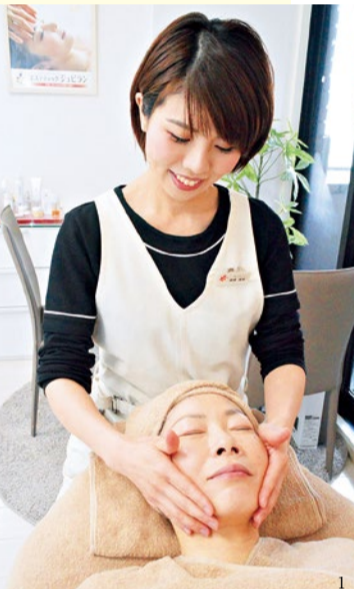
1.基本2,000円(税別)をベースにオプションメニューを2、3個組み合わせるとお手頃な価格設定。

「低価格、高技術、心温まるおもてなし」がモットーのジュビラングループ。その日の肌に必要なメニューを相談しながら選ぶ“セミオーダー形式”なので結果が見えやすいと好評。今回はこの時期に受けておきたい「ホワイトニングコース」を読者限定で用意。肌の奥の隠れメラニン生成を抑制、沈着を予防する高品質美容液をたっぷり使用。1回で「肌が白くなった!」と声上がるほどの効果を実感して。