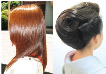
G-upシルキーはシルクプロテイン 日本和装師会の師範による配合で今までにない手触り。美しい着付け&ヘアも人気。

体験した人から「もっと早く知りたかった!」と喜びの声が続出のG-upストレート。髪が傷む縮毛矯正とは違い、数か月経ってもずっとしっとりサラサラ、ツヤツヤ。もちがよいので次回までの施術スパンが長い乾燥対策にも頼れるのでこの時期やっておくのがベスト。