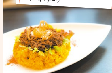
※写真はイメージです。内容は仕込により異なる。

▶セミナー参加申し込みはこちら下記URLの応募フォームより申し込みください。 https://pro.form-mailer.jp/fms/87a7f976140843