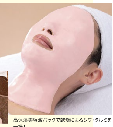
高保湿美容液パックで乾燥によるシワ・タルミを一掃!

深田恭子さんのCMでお馴染みのフェイシャルサロン。リーズナブルな価格設定なのに、本格的な施術が受けられ、継続して通いやすいと幅広い世代に支持されるフェイシャル専門サロン。夏のダメージを受けたお疲れ肌には同サロンのスタンダードコースにコラックスケアパックをプラスして!美容液成分たっぷりパックでシワ・タルミを撃退し、厳しい冬の乾燥に備えよう!