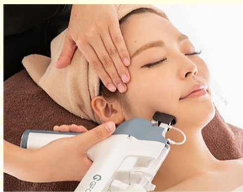
幹細胞は分裂する前の細胞であり、美肌に欠かせない成分として注目されている。その中でもスキンケアにとって必要な成分のみを抽出した「ヒト幹細胞培養抽出液」を贅沢に配合した美容液を専用マシンで導入。