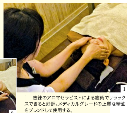
1 熟練のアロマセラピストによる施術でリラックスできると好評。メディカルグレードの上質な精油をブレンドして使用する。

「老け顔」の原因は肌だけでなく、ピツパくつついた筋膜と表情筋にもあるそう。本格的なスキンケアに取り組むなら、全てにアプローチできる同店の施術がオススメ。アロマフェイシャルに「筋膜リリース」を組み込んだコースは、目がパッチリ、肌が引き締まって弾力が増え、顔の引き上げ効果も抜群だ!仕上げのローズ水とバオバブオイルで子どものような柔らかい肌質を実現する。詳細はHPもチェック!