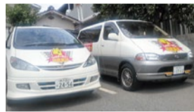
オプションの送迎サービスが好評。西宮市内(原則4km以内)であれば、保育園の中まで迎えに行って自宅まで送ってもらうことも可(1日4名限定、3歳以上、15時半～)。

でも「安心して預けられる」という声が多い。3～6歳対象のオレンジコースは月曜・金曜の夕方、土曜午前中に開講中。小学生以上は姉妹校の「ステップワールド」があるので、幼児期から小・中・高校生まで成長に合わせて英語力を持続できるのも強みだ。まずは体験レッスン & 説明会で雰囲気と考え方に触れてみよう。