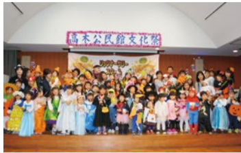
サマースクールやハロウィンパーティーなど季節の行事が盛りだくさん。幅広い経験を積みながら、英語力はもちろん精神面もぐんと成長!