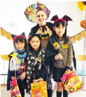
季節のイベントも充実、外部生も参加OK!

「英語の発音がキレイになった」と喜びの声が聞こえる実力派スクール。ネイティブ講師の英会話コースはベビー(1歳半～2歳半)から未就園児、小学生、中高生、大人まで幅広い。バイリンガルスタッフもしっかりフォローしてくれるから安心。日本人講師は初心者大人会話クラス、文法クラスを担当。フォニックス、英文法の定着も重視し、バランスよく「聞く、話す、読む、書く」の4技能を伸ばす。成果を実感できるスピーチ大会や、会話クラスでは参観があり、成績表で実力の把握もできる。英検対策講座も実施しており、合格実績多数! まずは、「保護者満足度96%」と充実した体験レッスンに参加してみてください。