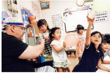
歌やダンス、パペットやフラッシュカードなどを採り入れた「英語を楽しむこと」を重視したプログラムにより、幼い頃からゲーム感覚で英語に触れられる。