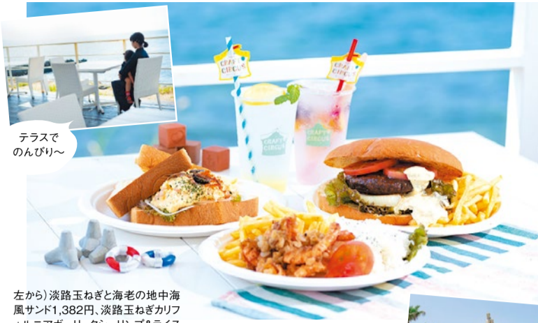
テラスでのんびり～

左から 淡路玉ねぎと海老の地中海風サンド1,382円、淡路玉ねぎカリフォルニアガーリックシュリンプ&ライス1,598円、淡路牛と淡路玉ねぎメガクラブバーガー1,814円