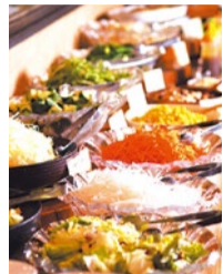
ランチタイムは15種類以上の新鮮野菜のサラダや総菜が並び、10月は葉の炊き込みご飯とトン汁がお目見え!

熊本県阿蘇の契約牧場で飼育から加工まで一貫して管理し、最高の状態でお店に届けられる食材のみを使用するレップフェル。生産者の顔が見える安心安全のお肉を一番美味しく味わうならステーキメニューがおすすすめ。自分の好みの焼き加減で焼いて食