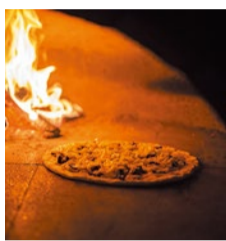
薪窯で焼き上げる本格ナポリピッツァ!450度の薪窯で一気に焼き上げるので生地はパリパリのサクサク!直径30cmでも丸ごと一人でもペロリといけちゃう軽さが驚き!テイクアウトもおすすめ。

べられ、肉の旨味を存分に味わうことができる。グラムも90gから選べるのも嬉しいポイント。またレップフェルの人気を支えるもう一つの秘密は全てのメイン料理にもれなくついでくるサラダバー。ランチタイムは15種類以上のサラダや手作り総菜が並び、すべて