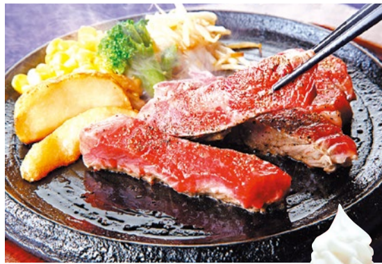
こだわりカットステーキ(120g)1,299円(税別)※ランチ料金全てサラダバー付き!※プラス220円で阿蘇牧場の濃厚ソフトクリーム食べ放題付きのドリンクバーもぜひ。