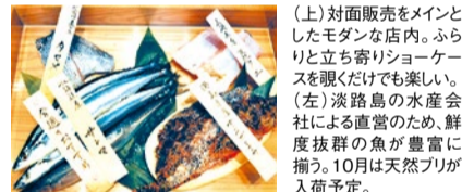
(上)対面販売をメインとしたモダンな店内。ふらりと立ち寄りショーケースを覗くだけでも楽しい。(左)淡路島の水産会社による直営のため、鮮度抜群の魚が豊富に揃う。10月は天然ブリが入荷予定。