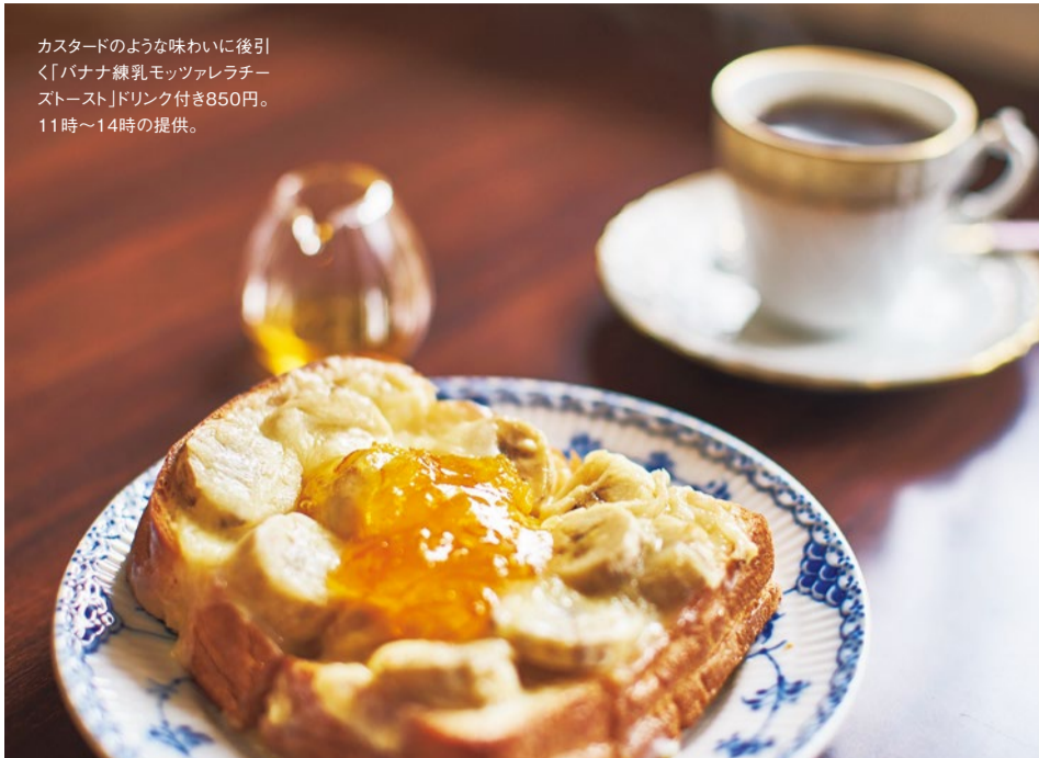
カスタードのような味わいに後引く「バナナ練乳モzzarellaチーズトースト」ドリンク付き850円。11時～14時の提供。

Cafe Nanpu 珈琲に合わせて誕生した 独自の 組み合わせに注目 閑静な住宅街に佇むカフェ。先々の珈琲専門店時代から珈琲豆は神戸の萩原珈琲を使用。オーダーごとにハンドドリップで提供する贅沢な一杯とトーストは至福のコンビ。アンティークミックスの店内は外国のようでありながら、自宅のようにくつろげる不思議な空間。