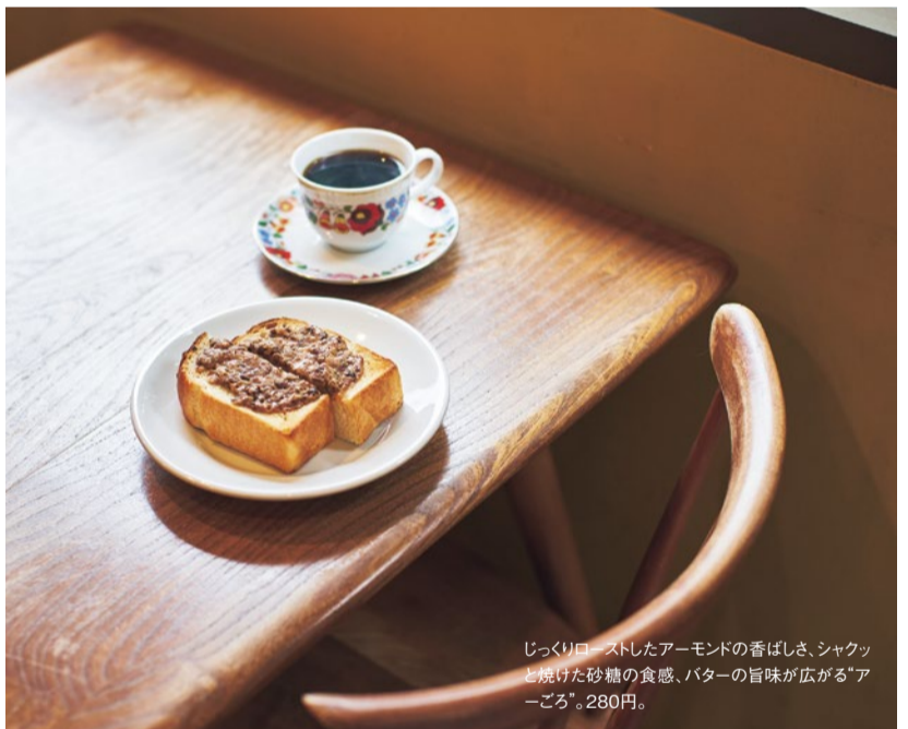
じっくりローストしたアーモンドの香ばしさ、シャクッと焼けた砂糖の食感、バター旨味が広がる“ア-ごろ”。280円。

トースター 毎日でも通いたくなる 絶品トーストの宝庫 生田川沿い、大きなガラス窓から光が差し込む素敵な店内でいただけるのは、大阪本町の人気店パンデュースの厚切り山食を使ったトースト。ア-ごろの愛称で親しまれる名物、アーモンドごろごろトーストは必食！好みのカップで楽しめる珈琲や紅茶も丁寧なおいしさ。