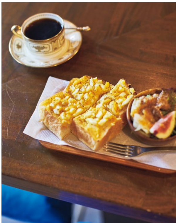
マスタードの効いたポロポロたまごトーストのモーニング600円はポロポロ零れることから常連さんが命名。