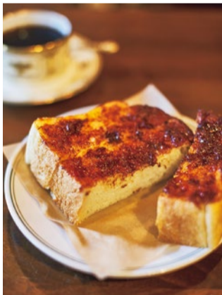
季節の移ろいに合わせて変わる自家製ジャムトースト350円。写真は柿と柚子。秋にはイチジクジャムが登場予定。