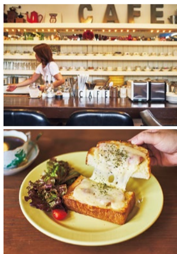
焼いた生ハムが塩梅のよいアクセントに「生ハムとマッシュルームのモzzarellaチーズトースト」ドリンク付き950円。11時～14時の提供。

Cafe Nanpu 珈琲に合わせて誕生した 独自の 組み合わせに注目 閑静な住宅街に佇むカフェ。先々の珈琲専門店時代から珈琲豆は神戸の萩原珈琲を使用。オーダーごとにハンドドリップで提供する贅沢な一杯とトーストは至福のコンビ。アンティークミックスの店内は外国のようでありながら、自宅のようにくつろげる不思議な空間。