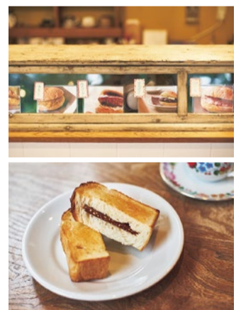
食パンのスリットでとろけるヘーゼルナッツチョコ&表面の有塩バターの、甘じょっぱさが虜になる“チョコト-”。

トースター 毎日でも通いたくなる 絶品トーストの宝庫 生田川沿い、大きなガラス窓から光が差し込む素敵な店内でいただけるのは、大阪本町の人気店パンデュースの厚切り山食を使ったトースト。ア-ごろの愛称で親しまれる名物、アーモンドごろごろトーストは必食！好みのカップで楽しめる珈琲や紅茶も丁寧なおいしさ。