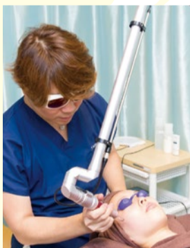
肝斑に効果が期待できる「レーザーニング」。当クリニックではアジア人向けに設計・開発されたマシン「Orion.Q」を採用しています。

肝斑には、話題のレーザーニング また30代、40代の方に多いのが肝斑です。主に目尻の下、ほほ骨に沿って左右にで