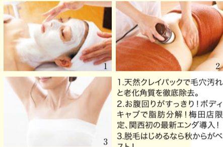
1.天然クレイパックで毛穴汚れと老化角質を徹底除去。 2.お腹回りがすっきり!ボディキャップで脂肪分解!梅田店限定、関西初の最新エンダ導入! 3.脱毛は始めるなら秋からがベスト!