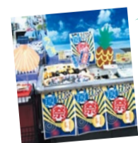
8月は地元の白川祭にあわせてお祭り感を演出しました!