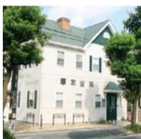
アロマの香りが漂い心安らぐ空間です。