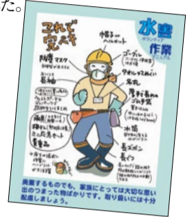
災害ボランティアの服装や携帯品も「レスキューストックヤード」のホームページでわかりやすく紹介されている。

ボランティア参加者の地域はさまざま。遠方の東北からの参加者も多く「困ったときはお互い様、東北大震災の時の恩返し」と報告書には綴られ、ボランティアの輪が広がっているのを感じた。