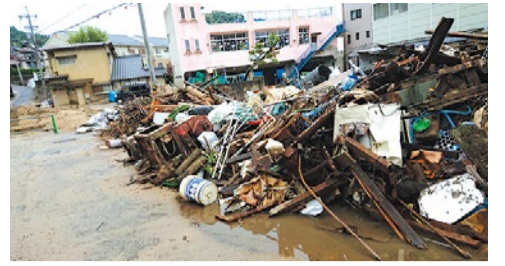
広島県呉市天応地区では、まだ土砂が積もったままの家屋が多く残る。(9月1日撮影)

西日本豪雨の被災地では土砂のかき出しや瓦礫等の撤去に人手が不足しているため、災害ボランティアの募集は現在も続いている状況だ。そんな中ボランティアの参加を考える読者に向け、本記事ではシティライフ記者が参加した際の体験も交え、参加方法を紹介していく。