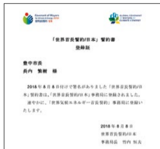
世界首長誓約日本の登録証。

防止地域計画」の中でも、国が設定した目標をさらに上回る高い目標を掲げており、目標達成に向けて太陽光発電設備やエネファーム設置に関わる補助金に加え、窓の断熱化やZEH住宅の新築に対する補助金事業も新たに追加。今後はさらに、SNSなども活用しながら市民のエコな取り組みを押し進める方針だ。