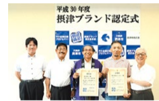
9月に行われた第2回摂津ブランド認定式の様子。

摂津市長は「こうした『摂津優品』の数を増やしていくことが『ものづくりのまち 摂津』として重要だ」、商工会会長は「今後は『摂津優品』を発展させるために告知や販売にも力を入れていきたい」と語った。