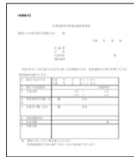
「災害派遣等従事車両証明書」は、まず現地のボランティアセンターから承諾書を受領し、ボランティア参加者が移住する市役所で発行の手続きをする。高速道路は無料で利用できる。※9月30日までの予定。

どが詳細に紹介され、ボランティアの心得も掲載されている。また、事前に自治体などがボランティアの受入れを承諾した場合、「災害派遣等従事車両証明書」が交付され、自宅から現地までの往復の高速道路の費用が免除されることもわかり、申請した。