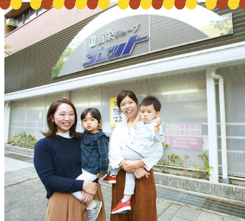
彩加ママ&えみりちゃん

まずはコインロッカーに荷物を預けて、貴重品や携帯など必要なものをビニールバッグの「私物袋」へ。