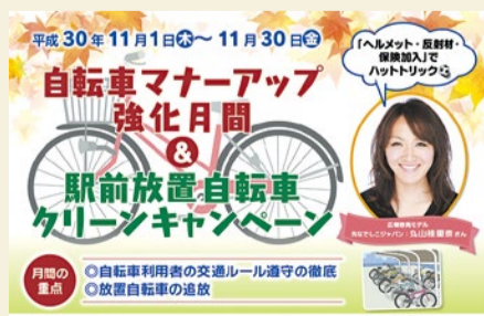
自転車マナーアップ強化月間ポスター

大阪府下における自転車関連事故は2018年8月末時点では、昨年同時期と比べて死者数は減少しているものの、件数と負傷者数は増加している。大阪府は全国的に見ても事故件数も多く、全交通事故に占める自転車関連事故の割合は30%を超えている。(平成29年中、発生件数及び負傷者数は全国ワースト)