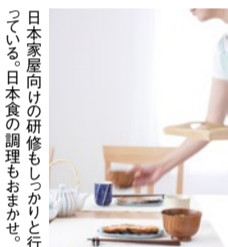
日本家庭向けの研修もしっかりと行っている。日本食の調理もおまかせ。

株式会社 ニチイ学館 サニーヘルス神戸店 神戸市中央区磯上通8-3-10 サービス提供日・時間/年中無休、6時~22時 ※サービスの開始は11月1日です。 ☎0120-32-2017 (24時間対応) ☎078-200-2103 (9時半~20時) https://www.sunnymaid.jp/