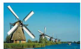
オランダといえば風車。キンデルダイクの風車群は世界遺産にも登録されています。