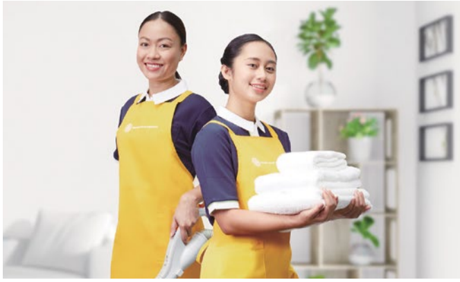
ニチイというブランドの安心感も、サニーメイドの魅力のひとつ。