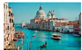
海の湯に浮かぶ水の都ヴェネツィア。