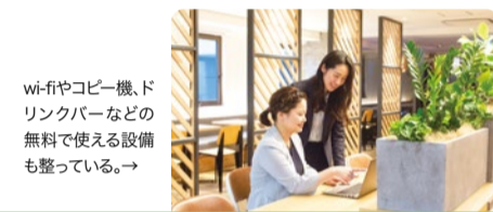
wi-fiやコピー機、ドリンクバーなどの無料で使える設備も整っている。→