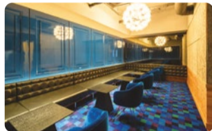
←くつろげるソファ席。英会話教室などのイベントにも活用できるスペース。