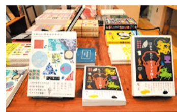
storage books ストレージブックス

デザイン会社である「神戸デザインセンター」が手がける書店。「アートをもっと身近に感じてほしい」という思いから、国内外のイラストレーターやデザイナーなどの作品・書籍が豊富に揃う。また、ZINEのラインナップは特に充実。カウンター席でドリンクを飲みながらアート・デザインの世界に触れてみよう。