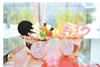
Jessy's coffee shop ジェシーズ コーヒー ショップ