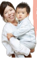
容羽ママ&ちはやくん