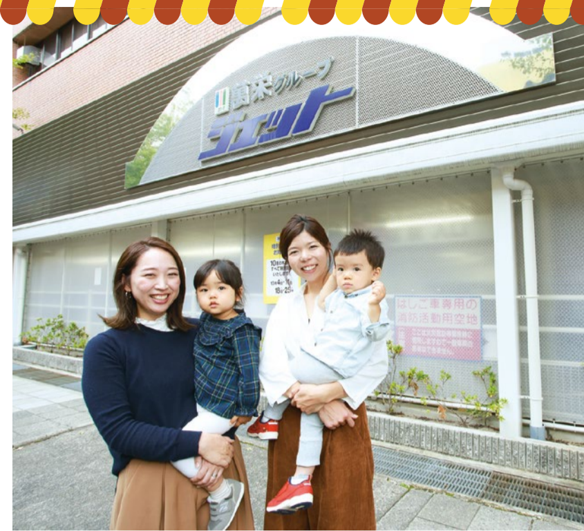
彩加ママ&えみりちゃん

まずはコインロッカーに荷物を預けて、貴重品や携帯など必要なものをビニールバッグの「私物袋」へ。