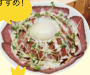
ローストビーフ丼 (800円)