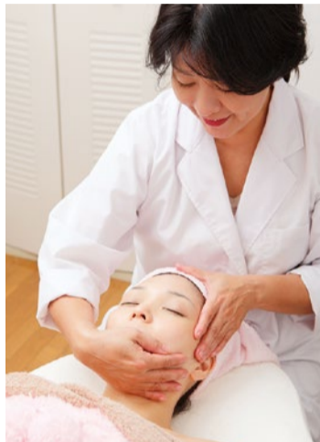
オーナーの人柄も魅力的。勧誘の心配いらずで安心の完全個室のプライベートサロン。

「たるみ、しみ、しわ、くすみ、毛穴の開き」といった加齢の悩みはリンパの詰まりや表情筋のゆるみだけでなく、頭皮のコリも大きな原因のひとつだそう。すべてのコースに含まれる独自のハンドテクニックで頭皮からしっかりコリを改善し、循環機能を高めて肌質を向上。さらにこだわりの美容機器を併用するので驚くほど効果を発揮。常連ゲストからは「とにかくマッサージが格別!気持ちがいいし、肌の状態が良くなっているという効果も実感できる」との声も。コースは悩みや予算に合わせてオリジナルで作ることもできるが、お得な今月号限定コースで同店の実力を試してみよう。