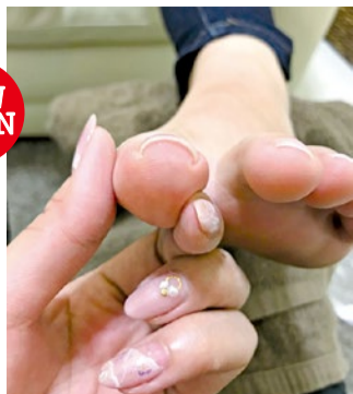
(上)軽度の巻き爪。自覚のない人も多い。

巻き爪や変形爪、ガサガサな足裏など、様々な爪や足のお悩みを改善するフットケア専門店がJR高槻駅すぐグリーンプラザ4Fにオープン。7,000人以上施術経験のあるJNA認定講師が丁寧に施術。1回でも痛みが軽減し、甘皮ケアや保湿もしてくれるので見た目も全然違うと評判。男性の来店も可能、まずは気軽に相談して。