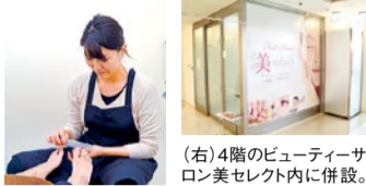
(右)4階のビューティーサロン美セレクト内に併設。