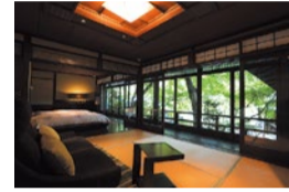
郷愁誘う雰囲気も魅力。窓枠の風景が一幅の絵のようなお部屋での宿泊もオススメ。