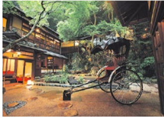
閑静な環境に佇む旅館。常々訪れるたびに心かきくつる。

先付、向付、焚合せ、焼物、台物、蒸物、酢物、食事、留椀、水物(12/1~2019年2月末まで)