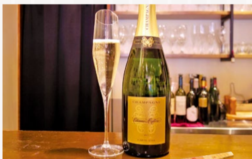
ブリュット・レゼルヴ カルト・ドール NV 5,940円

シニアソムリエの岡田知さん、チーズプロフェッショナルの妻・加奈子さんによるワイン&チーズ専門店「ル・プティ・コントワール」。シャンパーニュの豊富な品揃えに定評のある同店がおすすめるのは、エティエンヌ・ルフェヴールの「ブリュット・レゼルヴ カルト・ドール」。果実味豊かな味わいはゴーヤスかつ繊細。透明感、伸びやかさなど、ピノ・ノワールの名産地ヴェルズネイ村の魅力に満ちている。