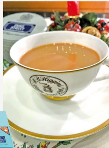
デュークストリート (ショート缶) 1,080円

1942年、ロンドンで創業したコーヒー・紅茶専門店「H.R.ヒギンス」。永年に亘り、英国王室エリザベス女王II世の御用店としての栄誉を授かる。神戸店がこの冬おすすめるのは、ロンドン本店人気No.1のブレンド「デュークストリート」。香り高く深みのある味わいはミルクとの相性が良い。寒い冬、温かいミルクティーでほっと一息ついてみて。