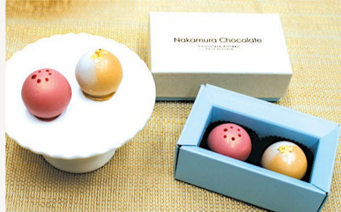
1st アニバーサリーセレクション (限定250箱) 1,080円

ショコラティエール・中村有希氏が手がける「ナカムラチョコレート」。オープンから一周年を記念し、アニバーサリーセレクションを発売。「ルビー サンセット」はルビーカカオ豆から生まれたチョコレート。自然由来のルビー色と、フルーティな酸味が特徴。「ゴールドサンライズ」は砂糖とミルクパウダーをキャラメリゼしたキャラメルチョコレート。アクセントの胡椒の風味がキャラメルチョコレートの甘さを引き出す。