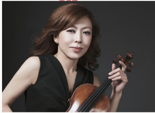
ジャズ・ヴァイオリニスト 寺井尚子 繊細な表現力と情熱的な演奏で人々を魅了するジャズ・ヴァイオリニスト。多くの世界的アーティストと共演し誰もが認めるジャズ・ヴァイオリンの第一人者としてジャズ・シーンをリードしている。

テレビ、ラジオ、CMへの出演や楽曲提供など、ジャズの枠組みだけにとどまらず、幅広く積極的に音楽活動を展開し、世界を舞台に活躍するジャズ・ヴァイオリニスト寺井尚子によるクリスマス・ジャズコンサートが加西市民会館文化ホールで開催決定。ピアノ・北島直樹、ベース・金子健、パーカッション・松岡"matzz"高廣、ドラム・荒山諒といったそうそうたるメンバーからなる「寺井尚子クインテット」が贈るクリスマス・ジャズ・コンサート。12月に聴けるのは関西ではこの日、こだけ！またオープニングアクトとして、加西市児童合唱団「さるびあっ子」混声合唱団「ヴォルケ」コーラスねひめ「ひまわりコーラス」が参加しオープニングを盛り上げてくれる。コンサート会場となる加西市民会館は中国自動車道「加西」