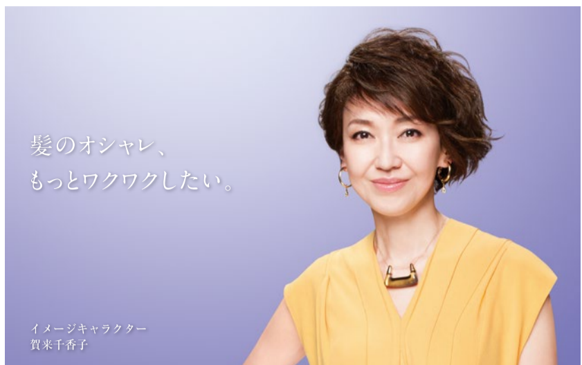
イメージキャラクター 賀来千香子