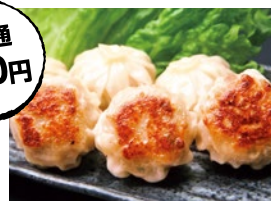
博多ひとくち餃子

ラーメンと相性ピッタリの餃子。ラーメン+餃子で楽しさ2倍以上!! ラーメンと相性ピッタリの餃子。今回もギョーザEXPOとしてご当地餃子などこだわりの餃子店がラーメンEXPOと同会場に登場します!ラーメン+餃子で楽しさ2倍以上!!