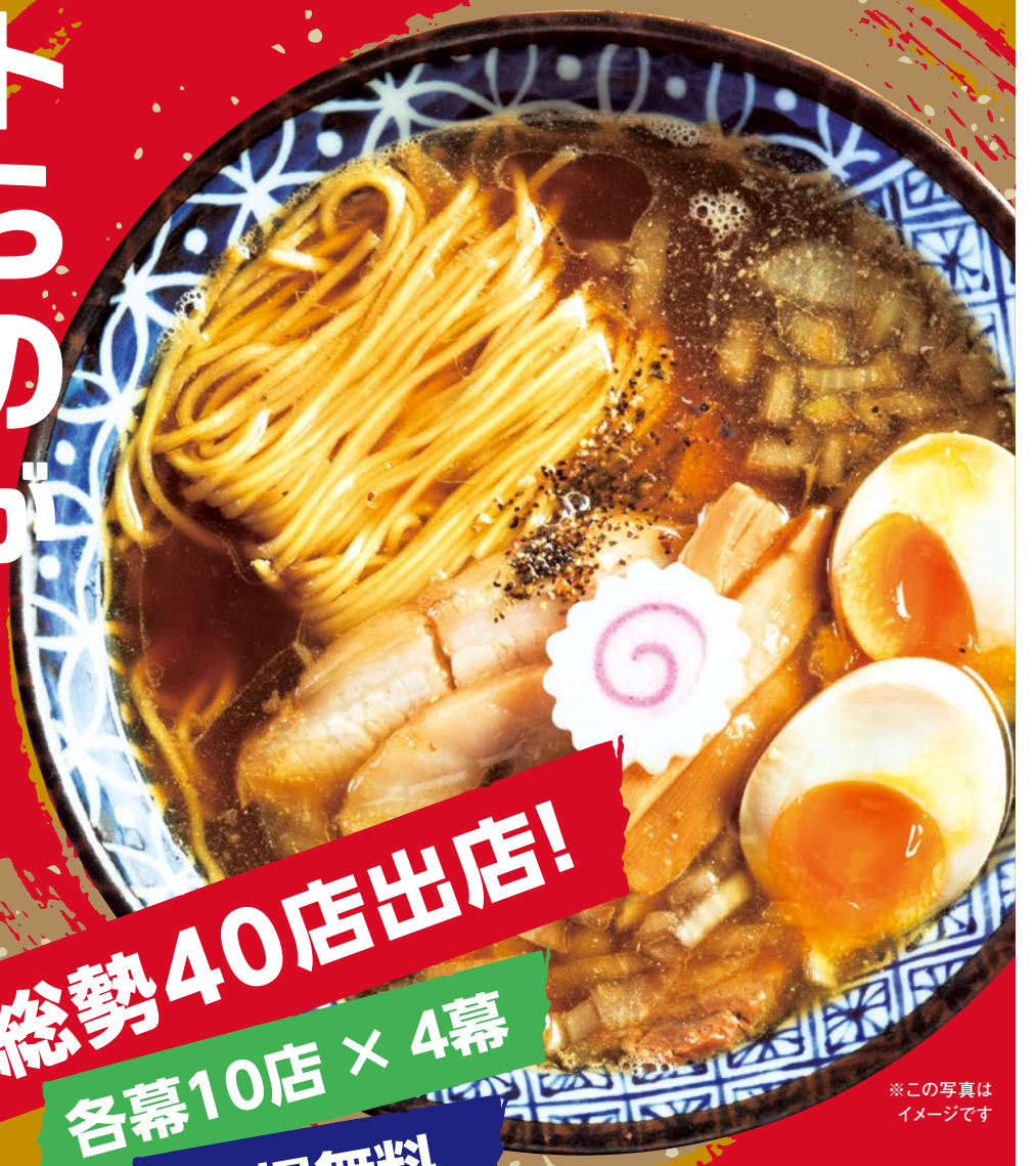
※この写真はイメージです

西日本最大級の ラーメンイベント 今年も全国から 選りすぐりの ラーメン店40店が 集結!