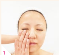
1 施術効果上げるため、クレンジングでしっかり汚れをオフ。肌の状態をリセットする。

肌のハリ感や弾力がアップして、ストレスや肩・首のコリ、目やあごの疲れも同時にスッキリ!「この充実感、グランモアでしか体験できない」と高い支持を得ている。肌の悩み、任せてみて。