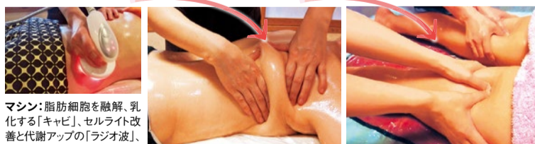
マシン: 脂肪細胞を融解、乳化する「キャビ」、セルライト改善と代謝アップの「ラジオ波」、中性脂肪を溶かし出す「LD」、タルミを引き締める「LED」の4機能で一気にサイズダウン!