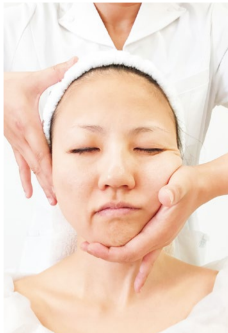
確かな成果と即効性でリピーターが絶えない同サロンのイチオシメニュー。大好評につき、1ヶ月前の予約がオススメ。

たるんでいく頬、深くなるしわやほうれい線……。年を重ねると、だれしも「10年前に戻れたら」と思うはず。そんな大人女性に試してほしいのが、グランモア