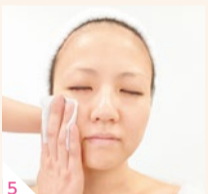
4 皮膚表面ばかりが筋肉まで念入りに刺激。肌の内側から活性化させて透明感・ハリのある素肌へ。肌質が変わっていくのを体感。