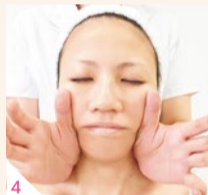
3 圧を加えて、潰した脂肪や老廃物をギュ〜っとリンパに流す。「イタ気持ちいい」感覚があるほど、脂肪や老廃物が溜まっている。目元や口元、輪郭がどんどん引き上がるのを実感し、一回り小さくなったフェイスラインに感激!