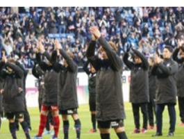
ホーム勝利時に行う「ガンバクラブ」を全員で行い締めくくった。

2019シーズンのJ1リーグの開幕は2月22日(金)と発表されている。来シーズンもぜひスタジアムでアツイ声援を贈り、みんなで一体となって「圧」を生み出そう!