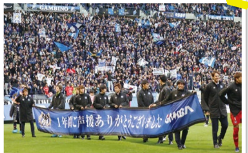
11/24(土)ホーム最終節終了後セレモニーを行い、ファン・サポーターに1年間の応援を感謝した。