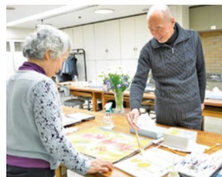
ガッシュ画講座の様子。「自由にさせてもらえるし、色々な色を重ねて絵を仕上げているのが楽しい」