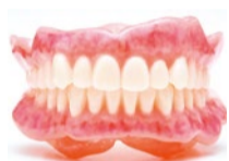
「BPS精密入れ歯」の製作費用は上下総入れ歯で80万円〜。保険外。