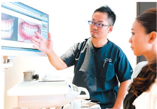
お一人だけの貸切診療で、カウンセリングや精密検査、治療計画、型取りなどすべて木下院長が責任を持って担当。1〜2時間程度のお時間をいただき、しつかりと丁寧に治療いたします。

「BPS精密入れ歯」の特徴はフィット感です。従来の入れ歯は口を開けて静止した状態の歯茎の型から入れ歯を作りますが、「BPS精密入れ歯」は口を大きく開ける、閉じる、イーと言う、ゴックンと飲み込むなど、7〜8通りの口の動きを特殊なシリコンに精密に写し取り、その型をもとにBPS国際ライセンスを持つ歯科技工士が作成します。そのため外れることはなく、ぴったりフィットした、しつかり噛める入れ歯になるのです。今まで入れ歯を何度作り替えても合わず、悩んでこられた皆さん、入れ歯を作るのは当院で最後にしませんか?