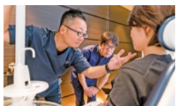
入れ歯専門技工士も診療に立会い、患者様の細かなご要望にお応えいたします。