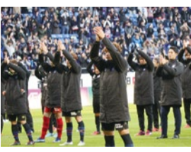
ホーム勝利時に行う「ガンバクラブ」を全員で行い締めくくった。

戦で、敵将・城福監督から「2019シーズンのJ1リーグの開幕は2月22日(金)と発表されている。来シーズンもぜひスタジアムでアツい声援を贈り、みんなで出そう!」