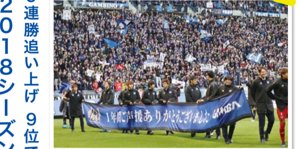
11/24(土)ホーム最終節終了後セレモニーを行い、ファン・サポーターに1年間の応援を感謝した。