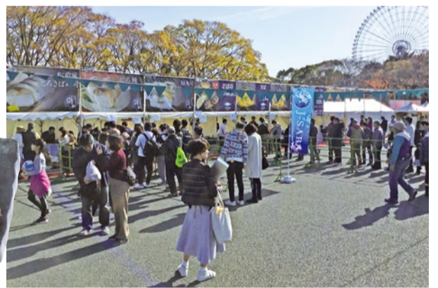
3日間で4万5千人が来場し、多くの人で賑わいました。