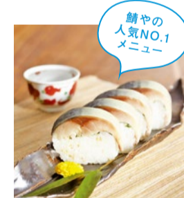
鯖やの人気NO.1メニュー