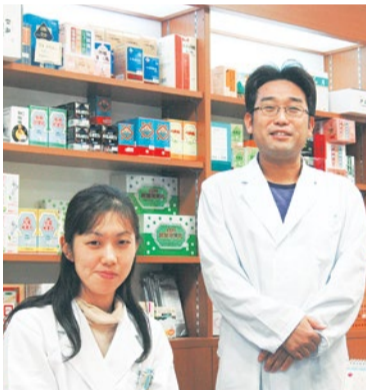
「漢方薬を身近に親しんでいただくこと」が同薬局のコンセプト。アトピーや不眠症にも漢方を用いた中医学で身体にやさしく対処。

不妊治療と一口に言っても、卵の発育状態や血流の流れ・冷え・ストレスなどその要因は人それぞれ。漢方の「相談薬局」として地域の頼れる存在の同薬局では、30分~1時間程の時間をとってじっくりと相談に乗ってもらえるため、一人ひとりに合わせた漢方薬を処方してくれる。中でも胃腸への働きかけに焦点を当てており、カラダの基礎代謝・基礎体力を上げることで全体バランスを整え、多くの原因改善に根本から取り組むのが特徴。「専門クリニックで原因不明と診断されても、根本治療で最後は自然妊娠できました」という例も多数。相談は無料なので、まずは気軽に足を運んでみて。