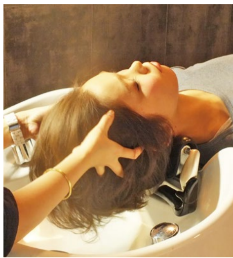
ヘッドスパと商材でやさしく頭皮を洗浄。髪が生えてくる頭皮環境を整えることが第一という。