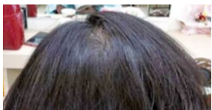
(アフター) このゲストはコースを始めて6か月後にはつむじが隠れるほどに。※個人差あり。