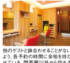
他のゲストと鉢合わせることがないよう、各予約の時間に余裕を持たせている。関西圏以外から訪れるゲストも多い。