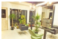
育毛相談時は完全プライベートサロンなので、デリケートな髪の悩みも人目に触れず相談可能!