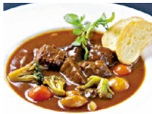
絶品の神戸牛ビーフシチューをご賞味あれ!

神戸の老舗「モーリヤ」グループが運営するカジュアルレストラン。今回は、メインを神戸牛の赤身ステーキとビーフシチューの2種から選べるシティライフ限定コースが登場!ランチでもディナーでもOK。3月末までの特別メニューだ。ソファ席があるので、ファミリーや各種集まりでゆったり過ごせるのもうれしい。