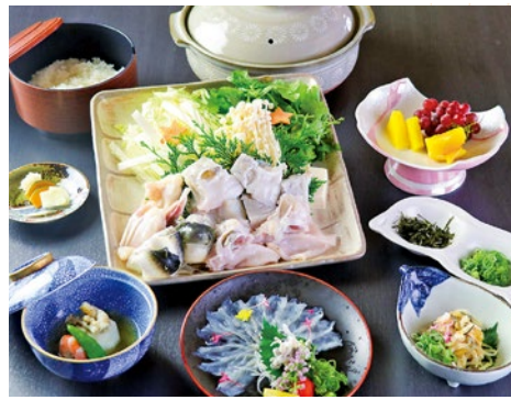
豪華7品が並ぶ、ふぐ会席コース。

「シティライフを見た」とランチをご注文の方に 特製米粉クッキーをプレゼント! (2月末まで。お1人様1点限り)