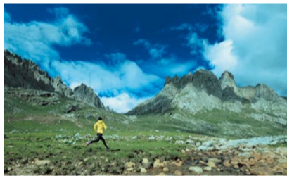
トレーニングは30分間の自走式ランニングマシンを使用し、ランニングやウォーキングを行う。※画像はイメージ。

同スタジオでは、標高2,500mの高地に相当する酸素濃度空間を実現。高地環境での運動は30分で2時間分の運動効果が期待できると言われ、注目を集めている。高地トレーニングの研究実績がある大阪市立大学の岡崎和伸教授がプログラムを監修。心肺機能の向上や、筋肥大、筋持久力の向上を促進する可能性